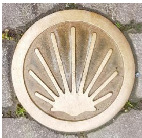
Gestileerde bronzen Jacobsschelp

St. Gerlach geven ze de weg aan naar het refugium 2 , het simpele pelgrimsonderkomen ‘ Si Dieu le veut, j’ arriverai ’ (Als God het wil, dan kom ik er aan).