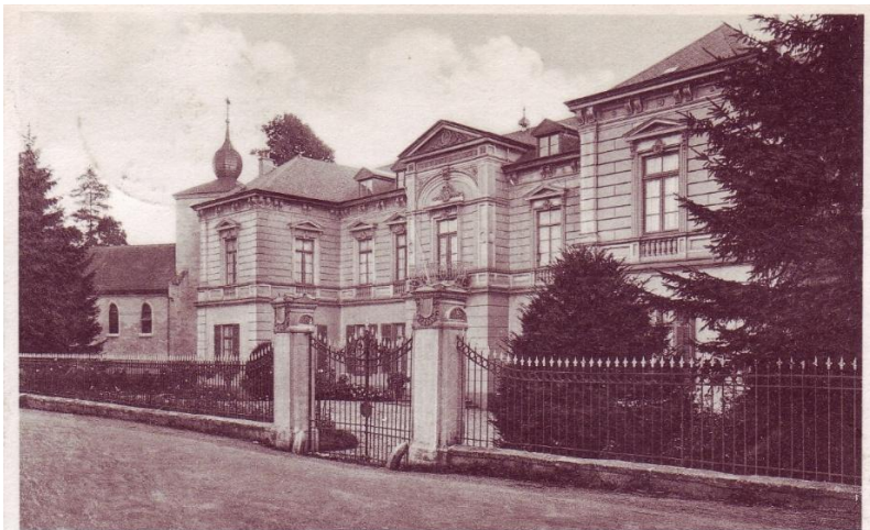
Pension Klooster „Vroenhof“, Houthem

In 1950 keerde ze terug naar Zuid-Limburg, woonde even in Meerssen en verhuisde op 1 maart 1951 naar 'Huize Vroenhof' in Houthem.