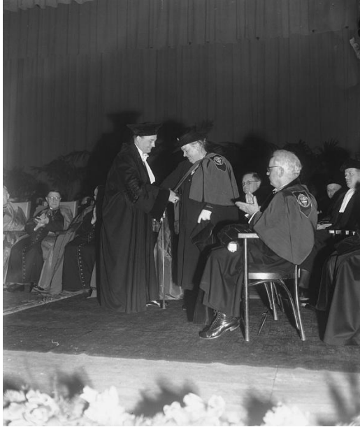
Uitreiking eredoctoraat Nijmegen 1949