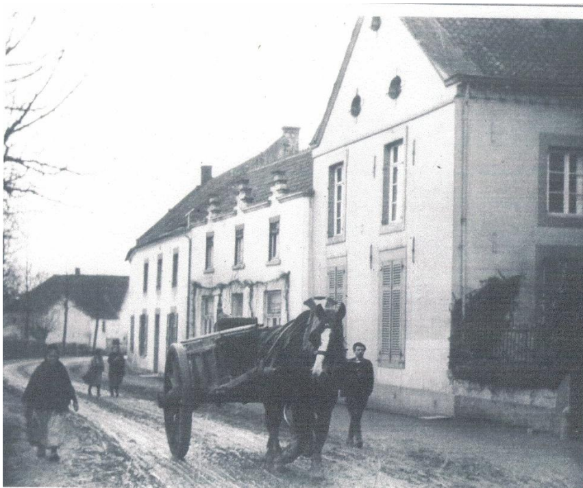
Sjlaagkar op de overkiezelde landstraat voorbij hoeve Strabeek.

Niet verwonderlijk dus dat in 1752 de Staten van Valkenburg zich erover beklagden dat de wegen er heel slecht en bedorven bijlagen en nauwelijks of niet zonder gevaar te gebruiken waren door rijtuigen met disselboom, getrokken door een gespan van twee, vier of zes paarden. De slechte staat van de landwegen werd geweten aan de zware karren van de “ landluijden ” die de paarden achter elkaar inspanden zodanig dat de hoeven en wielen diepe voren in weg trokken. De dubbel bespannen luxe rijtuigen uit de stad liepen erin vast. De nog niet zo heel lang uit het straatbeeld verdwenen “ sjlaagkarren ” werden als schuldige aangewezen.