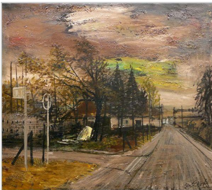
Vroenhof Charles Eijck 1973, olieverf 80 x 90

Na 250 jaar heeft de A79 de functie van doorgaande weg en heirstraat overgenomen. Het traject door Houthem kan voor 5,8 miljoen euro anno 2025 weer de rustige slingerende dorpsstraat worden die het lang geleden was. 4