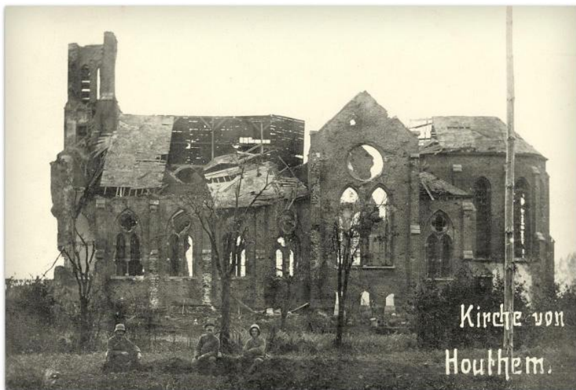
Foto van het door WO I getroffen Belgische Houthem

Met het Nederlandse Houthem-St. Gerlach heeft deze 'Houthem street' in Brisbane dus totaal niets te maken.