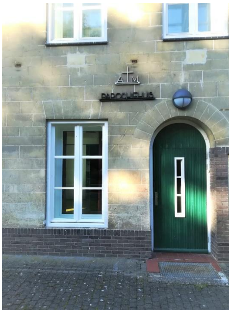
Parochiehuis oktober 2021

Zachtjes neurie ik het Agnus dei mee. Blij als het eindelijk afgelopen is, snel ik naar buiten, het boek stevig in mijn hand geklemd. Op het oude kerkhof zwaai ik naar opa en oma die mij vanuit hun graf begroeten.