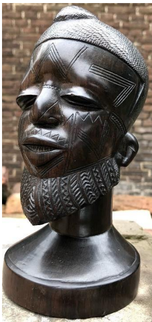
Een Maconde beeldje in zwart ebbenhout.

De Maconde hebben van oudsher houten huishoudelijke voorwerpen gemaakt, voornamelijk van het zwarte ebbenhout Blackwood. Later komen daar figuren, beeldjes en maskers voor ritueel gebruik bij. Ze vormen nu een belangrijk onderdeel van de Afrikaanse kunst. Pater Hein ziet mogelijkheden om beeldjes te kopen en naar Nederland te vervoeren. Het is vaak een kwestie van onderhandelen met de kunstenaar, maar uiteindelijk worden ze het altijd eens over de prijs. Er moet wel nog iets verdiend worden met de verkoop hier op fancy-fairs en markten om zo de financiële middelen te verwerven voor zijn missiepost. En dat is ook in het voordeel van de kunstenaars.