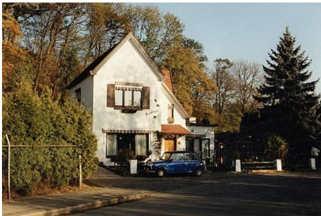
Het huis aan de Kloosterweg in 1989.

Als zoon Hein dertien jaar oud is geeft hij te kennen dat hij een priesteropleiding wil gaan volgen om daarna uitgezonden te worden als missionaris. Er wordt gekozen voor de opleiding bij de orde van de Montfortanen, die missionarissen uitzendt naar landen over de hele wereld, zoals Haïti, Malawi, Peru, Colombia, Congo en Mozambique. Het is een belangrijke beslissing in zijn leven. In 1926 wordt hij student aan de gymnasiale opleiding van de Apostolische School St. Marie in Schimmert. Hij verblijft er tot 1934, waarna hij het noviciaat maakt in Meerssen. Daar wordt hij een jaar later geprofest. Van 1935 tot 1941 studeert hij aan het Grootseminarie in Oirschot en wordt daar tot priester gewijd.