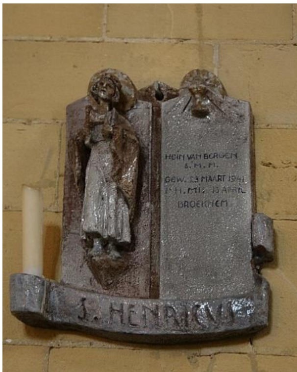
Het kunstwerk aan de muur in de St. Josephkerk in Broekhem met de tekst van de Eerste H. Mis op 13 april 1941.