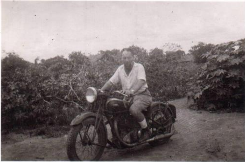
De pater op zijn motor

Dan is hij druk in de weer. Bezoekt donateurs, houdt fancy fairs en zelfs een filmvoorstelling. Zo is hij in het voorjaar van 1952 voor het eerst terug in Valkenburg en op 16 mei is er een missienaakrans met een tentoonstelling en een fancy-fair in Broekhem.