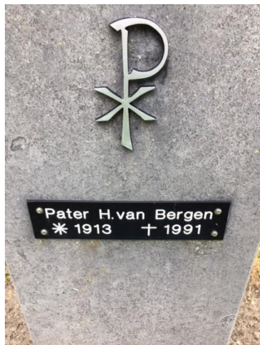
De grafsteen op het kerkhof van de Montfortanen in Schimmert.