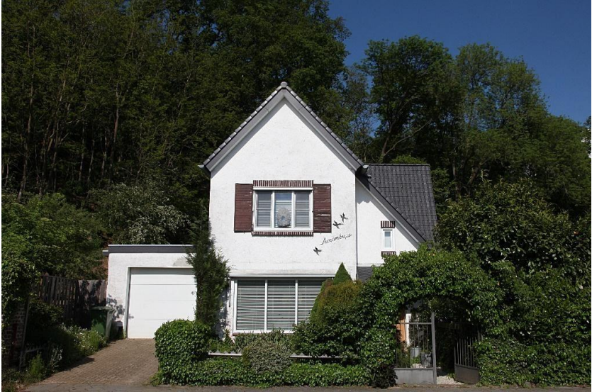
Het huis 'Moçambique' aan de Kloosterweg nummer 32, anno nu.

Met dank aan: Jo van Aken, Piet van Bergen, Fons Heijns, Historisch Archief Valkenburg Martin Stevens Fonds, pater Hub Kleijkers s.m.m.