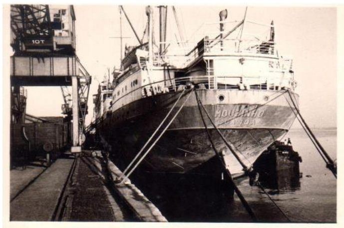
Het schip de 'Mouzinho' in de haven van Lissabon.