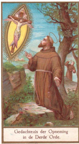
Gedachtenis der Opneming in de Derde Orde.