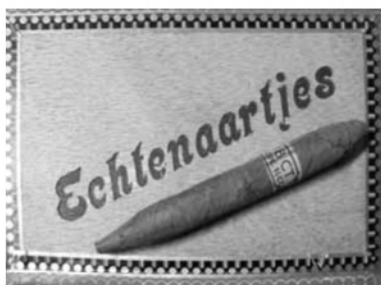
Dit kistje is nog bewaard gebleven en te bewonderen in het archief van het Museum voor de Vrouw

De Echtnaartjes die de gebroeders Coonen als merknaam voeren naast de bekende Adelaar