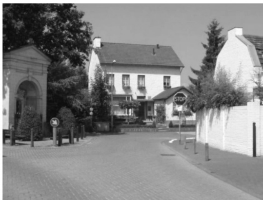
Situatie hoek Onderstestraat- St. Gerlachstraat in 2003